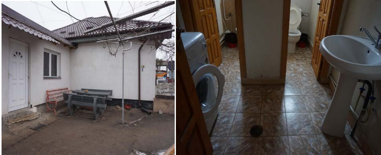
Baza de dezăpezire Bacău 1

momentul în care poate pune în valoare experiența colectivului său, iarna reprezentând anotimpul cu cele mai mari și multe provocări.