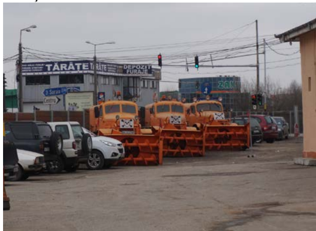
Bătrânele autofreze încă funcționale

În aceeași incintă am găsit în activitate formațiile de lucru de la Baza de dezăpezire Focșani, constatând că unii dintre deservenți sunt deja reveniți din acțiunile de pe drumurile Vrancei, unde pleaseră cu mult înainte de ivirea zorilor. Dormitoarele și spațiile de odihnă de aici sunt întreținute și folosite corespunzător, condițiile fiind realizate și aduse la nivelul cerințelor odată cu lucrările de reabilitare a DN 2(E 85).