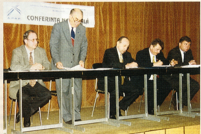
Conferința Națională a A.P.D.P., Bistrița Năsăud, 1997