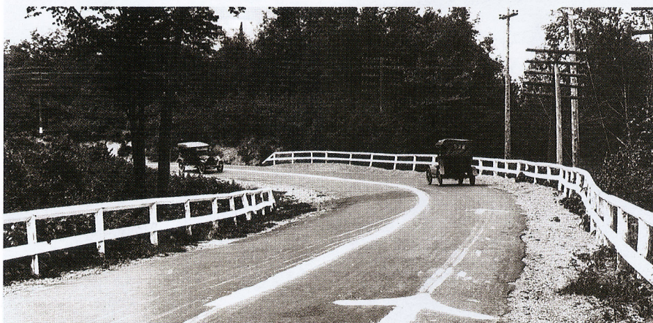
„Curba Mortului” situată pe drumul care leagă localitățile Marquette și Negaunee în Marquette County, statul Michigan, SUA. Imagine din anul 1917, în care se poate observa linia de mijloc, trasată manual.

Deși a trecut aproape un secol de la primul marcaj rutier, până în prezent nu au fost descoperite alte elemente prin care să fie înlocuit. Cele mai importante schimbări au privit calitatea materialelor și a metodelor de aplicare a marcajelor, asigurând astfel una dintre cele mai importante condiții pentru realizarea și menținerea siguranței pe drumurile rutiere. Desigur, cel mai important lucru este acela că se asigură aspect, longevitate și vizibilitate bună în orice moment, indiferent de condițiile meteorologice noapte și de zi.